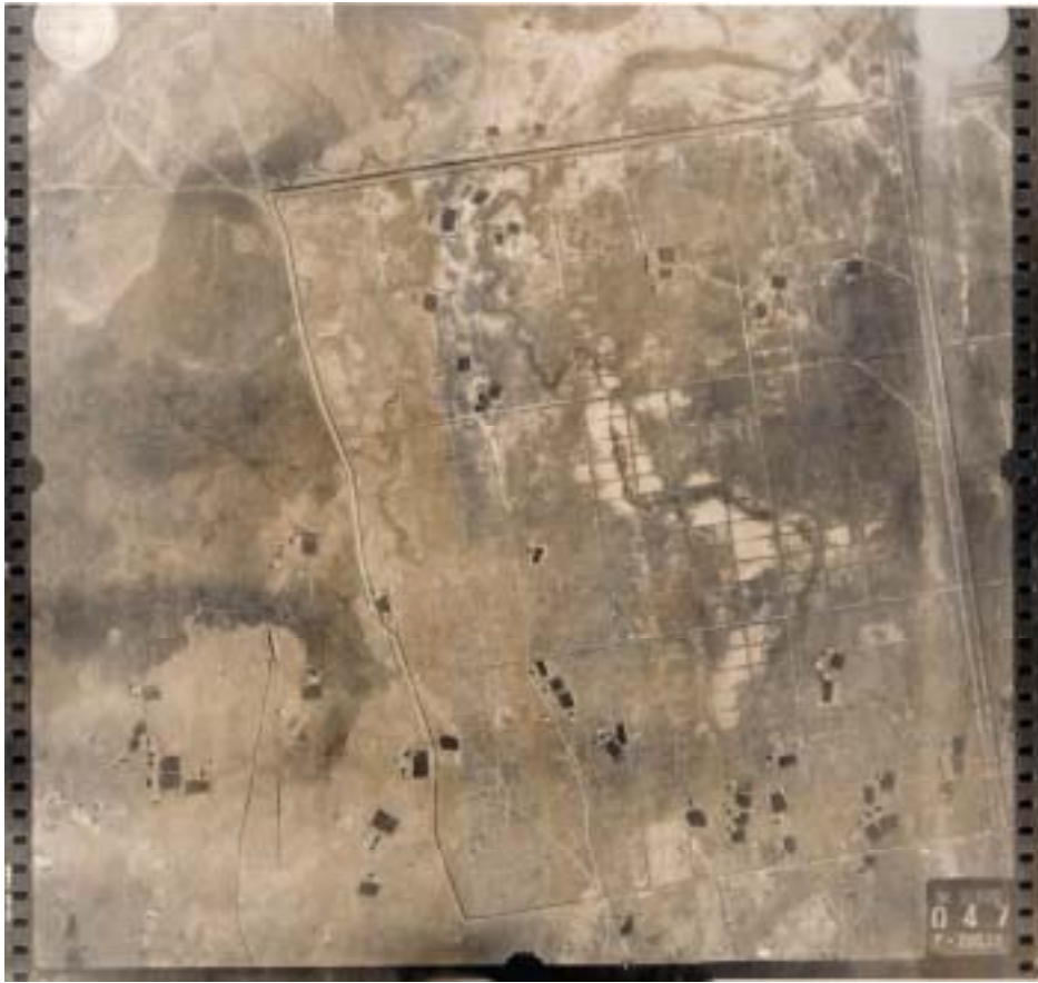
写真1 旧日本軍撮影の中国中支地域の空中写真

枚，界首鎮西方 87 枚，阜寧南方 120 枚，宝應西南方 197 枚，六甲鎮地区 258 枚，興化地区 265 枚，中支地域 854 枚である。