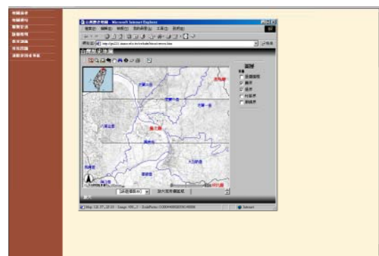
図2 台湾歴史文化地図システム ( http://thcts.ascc.net/ ) 『臺灣堡圖』などをベースマップとして公開