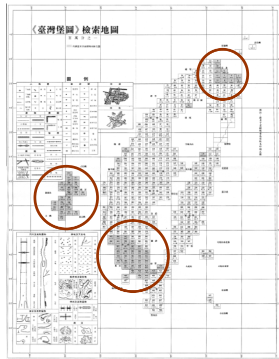
図1 『臺灣堡圖』に未掲載の地図

および『国外地図一覧図』（全4巻、図3）を参照することとした。それはこの目録が現時点で最も体系的に外邦図を記したものと考えられるからである。この目録や一覧図は、1958（昭和33）年に防衛庁防衛研修室（現防衛研究所）の予算により、地理調査所（現国土地理院）が作成したものであり、当時、地理調査所が保有して