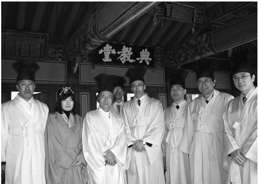
陶山書院における謁廟礼参加