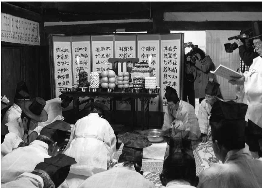
金楊震旧宅不遷位祭祀

翌十一月三日と四日、二日にわたって国際学会が開催された。場所は安東市内から二十kmほど山の中に入った