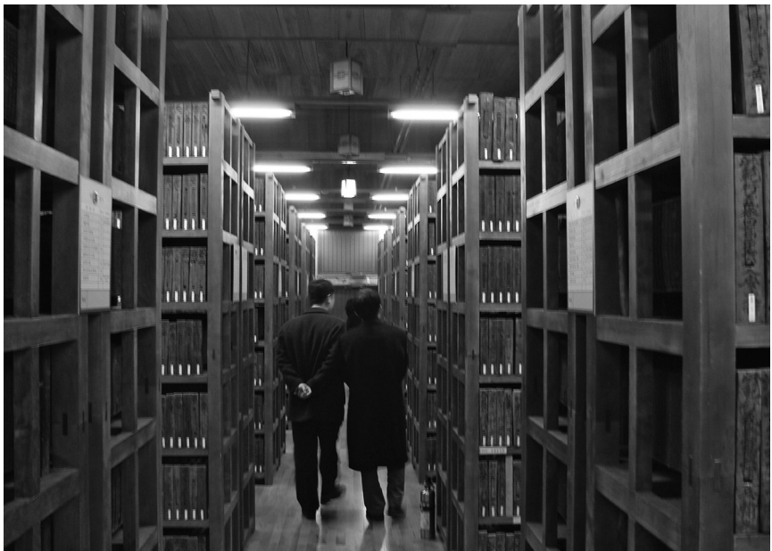
韓国国学振興院蔵板閣

午後から翌日にかけて学会が開催された。全体テーマは「朱子家礼と東アジアの文化交流」。筆者が発表した四日の分科会は「日本家礼文化の諸様相」であった。筆者の発表タイトルは、「朱子『家礼』と懷徳堂『喪祭私説』」