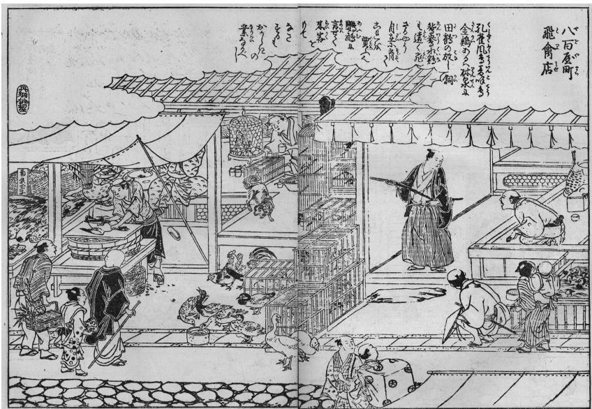
大坂船場の八百屋町筋 飛禽店 (『撰津名所図会』巻四)

*その他、菅原浩他編『日本鳥名由来辞典』(柏書房、一九九三)にも「錦雉」の名は見えない。