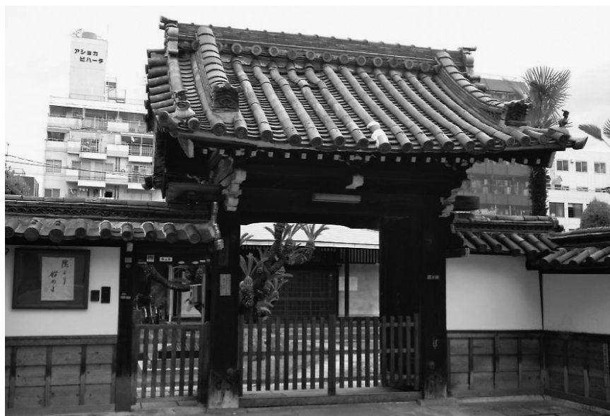
五井蘭州の墓のある実相寺の門（上本町）（二〇〇八年四月一九日 著者撮影）

し）、奔走するようだ。独り行けば感じやすく、気持ち がふさいで行きなすむ。ようやく実相寺の丘に上り、苔 むす墓に参り掃除する。これが先師の幽室だ。お声とお 姿を思い出して涙を流す。時間が速やかに過ぎるのを 嘆くうちに、三回忌がもうすぐ来る。先師の学を継ぐ者 はなく、誰がその徳を頌え事跡を記そう。弟子と旧友は、 涙を拭って相談した。「結果」我が兄弟は、久しく学問 しかつ文才があるとのことで、兄が文辞を撰し、弟が文 字を書いた。よくよく考え、遂に念願を遂げた。墓石を 買って石工に命じ、よくよく相談し、墓碑はけっこうに