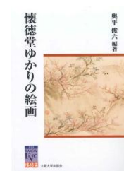
『懐徳堂ゆかりの絵画』