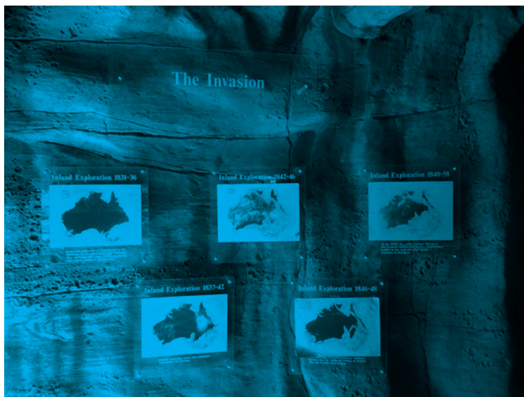
写真4 侵略と題された探検の地図。

このグループの博物館としては、フライング・ドクター・サービスの誕生と発展を扱ったクロンカリーの航空医療博物館、つまりジョン・フリン・プレイスト、オーストラリアの第2