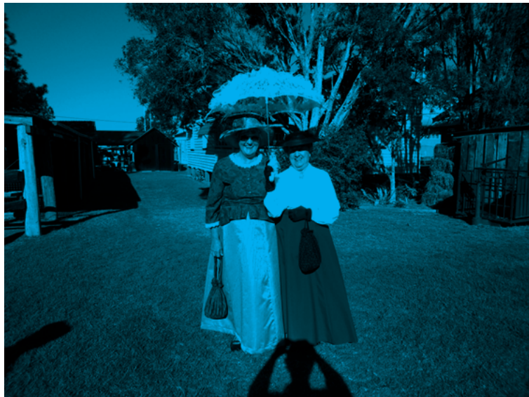
写真 1 ボランティアの女性たち、植民地時代の衣装を身につけて協力している。

ハーヴィー・ベイ歴史村が他の地方の博物館と異なり、極めて優れているところが 2 点ある。それが、歴史村が優秀な博物館として繰り返し表彰を受けている理由だと思われる。一つ目の優れた点は、歴史村が 19 世紀から 20 世紀初めに建てられた建築物を施設内に移築し、ボランティアの労力で修復し、建物が使われていた様子を生き生きと再現しようと試みている点である。例えば、開拓時代の生活を再現した小屋、そこにはベッドやテーブル、その他生活用具だけでなく、ウサギ狩りに使われた罠のような道具も備えられている。駅舎は、クィーンズラン