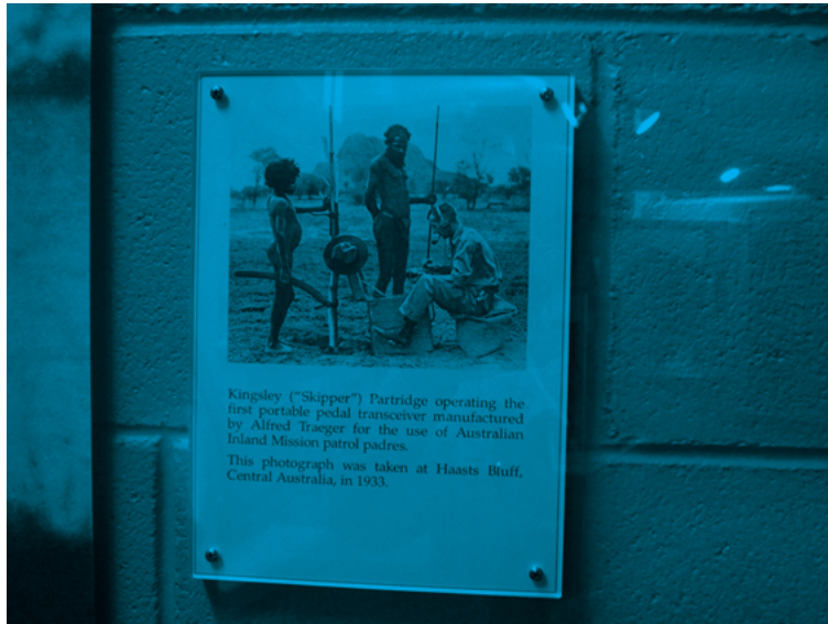
写真5 先住民に関する展示写真の1枚。

で唯一の施設というキャッチフレーズは正しくはない。実際は複合施設である。アートギャラリー、カンティルダと呼ばれる地域の博物館、芸術作品などの特別展示室などが併設されている。とりわけ、カンティルダは、1970年に設立された地域の歴史協会が1972年オープンした、地域の歴史博物館を包含した展示場である。包含とは表現したが、実は施設の面積の半分以上をカンティルダが占めている。カンティルダは、典型的な地域の博物館の様相を呈しており、機関車や駅舎、農業機械、衣類、靴、ビン、銃、レジスター、カメラ、タイプライターなど、さらに先住民の道具や写真などが、脈絡もなく展示されている。何らかの主張が見られるのは、ウintonの牧畜業の発展と戦争への参加を誇らしく展示しているところで、これも地域の博物館に一般的に見られる特徴である。