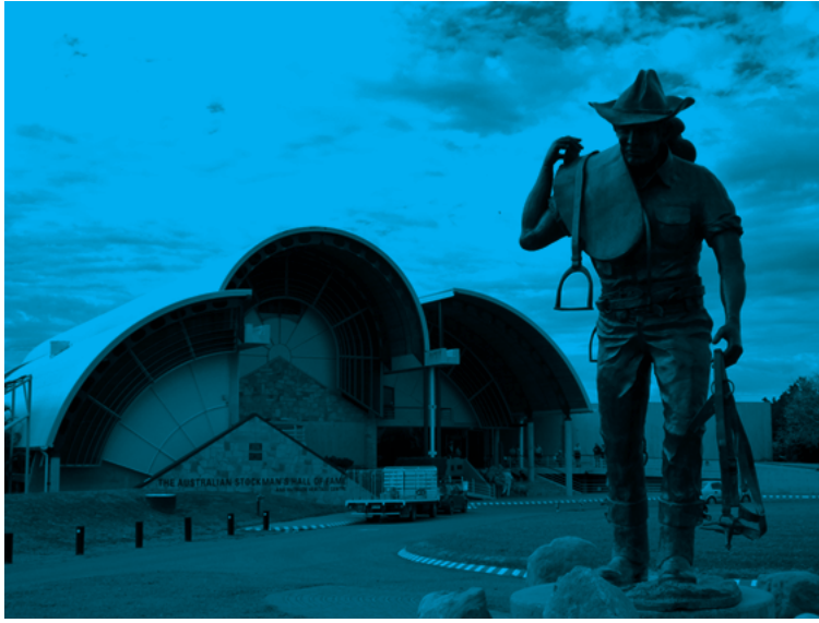
写真6 スtockマンズ・ホール・オヴ・フェイムの正面入り口。

識の木」のモニュメントが存在し、この地で、オーストラリアで最初の労働党が創設されたと主張されている。小さな町ではあるが、オーストラリアの労働運動にとっては重要な町である。ワーカーズ・センターは、1991年に設立され、政府や自治体からの恒常的な援助を受けずに運営されている施設である。入館料は、大人16ドル、子供9ドルと、安くはなく、2回訪問しているが、いずれの折にも入館者はあまりいなかった。年間入館者は約2万人である。収益の向上が喫緊の課題となっているようで、政府から女性労働者の展示の拡張のために170万ドルの援助を受けたり、集客のために「世界初の山羊博物館」の設立を提案して、新たな援助を受けようとしていたりしている。また、アウトバック教育センターを併設して、中高生の短期的な教育の場としての活用も図っている。こうした問題はあるにしても、この町の経済にとってはきわめて重要な施設であることは間違いない。