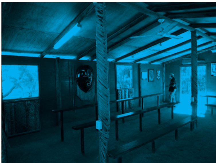
写真3 トレス諸島民コンプレックスの内部。

その次に向かったのは、最大のアトラクションである建物の内部に再現された30メートル強の砂岩の洞窟である。ここではガイドが説明してくれた。展示は、探検家であり植民地官僚でもあったエドワード・ジョン・エアの、先住民を追い払い、私たちは先住民が持っていたすべてのものと自由を奪い取り、その代わりに先住民には、悪名と軽蔑と墮落を与えたという旅行記の引用から始まる。これは一般の博物館ではあまり見られない描写で、印象に残っている。それに続くのは、オーストラリアを代表する考古学者ジョン・マルヴェイニによるケニフ洞窟の発掘の成果とその意義の説明、キング・プレートを首にかけた先住民3人の写真、牧場