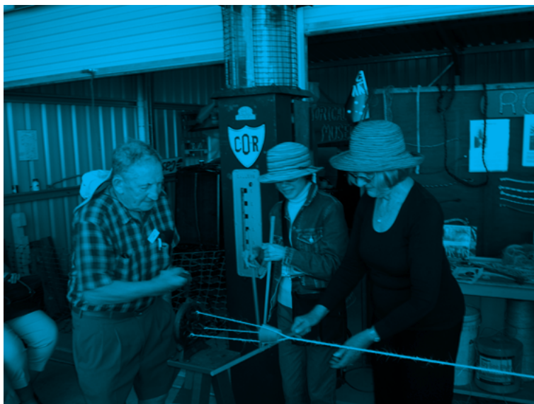
写真2 観客が指示に従ってロープ作りに挑戦。

地方の歴史を主な対象とする博物館の展示内容と展示の仕方は、こうした博物館に典型的に見られる形、つまり地域の歴史の雑多でまとまりのない内容を、一応のカテゴリーはあるが、カテゴリー間の脈絡なく展示するというものであった。設立年の新しいマリーバ博物館や、連邦政府の援助などもあり近年拡大しているハーヴィー・ベイ歴史村では、先住民関係の展示が見られたが、チャータズ・タウアズ博物館にはそれがなかった。この点では、連邦レベルの政