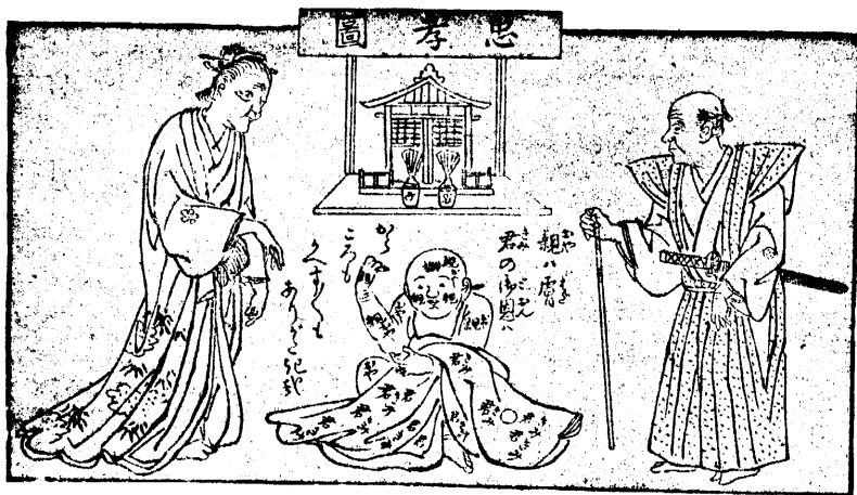
大田全齋先生著忠孝圖