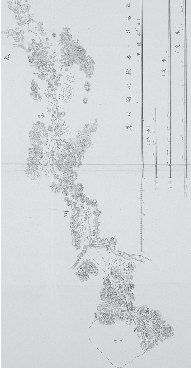
国立公文書館内閣文庫蔵 (177-202)、36.5 × 97.2cm の左半のやや下部をトリミング (左端が漢城) 米突のスケールの1目盛りが1,000m、図の左が北