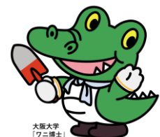
大阪大学「ワニ博士」

※お申し込みの際の個人情報については、利用目的以外の使用は一切いたしません。 ※当日は歩きやすい服装・靴でお越しください。 ※参加者には、2026年4月30日(木)までに、施設部企画課総務係よりご連絡いたします。