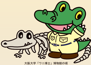
大阪大学「ワニ博士」博物館の頃